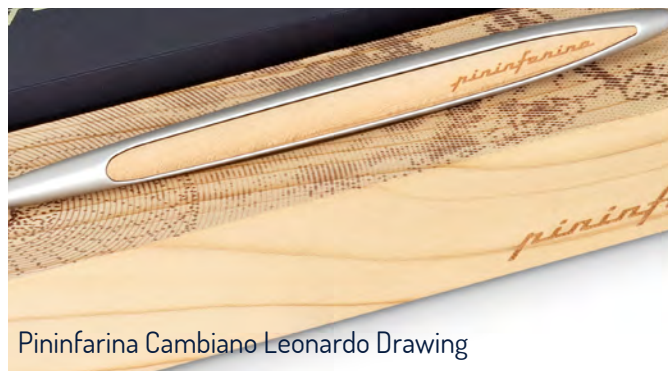
Pininfarina Cambiano Leonardo Drawing

Completano la linea due versioni esclusive di Pininfarina Cambiano: Pininfarina Cambiano Silver Luxury Edition , uno stilo completamente in argento 925 realizzato attraverso Additive Manufacturing e arricchito in superficie da geometrie esplorate da Leonardo da Vinci nei suoi studi sulla quadratura del cerchio; Pininfarina Cambiano Leonardo Drawing che ricostruisce il suo famoso Autoritratto secondo l'andamento in espansione di una spirale logaritmica, simbolo universale di perfezione. ▶