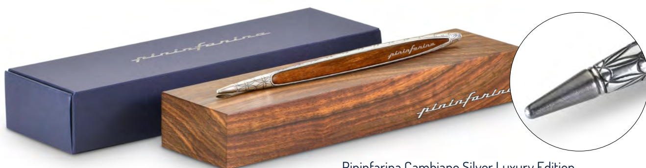
Pininfarina Cambiano Silver Luxury Edition

Come affermato da Paolo Pininfarina , Presidente del Gruppo, “quando il design incontra l’innovazione nascono progetti straordinari. Con la collezione Leonardo500th abbiamo reso omaggio al più grande talento italiano universalmente riconosciuto, dando forma ad un nuovo capitolo di questa storia eccezionale”. “ Leonardo da Vinci è maestro e fonte d’ispirazione per Pininfarina Segno , che da sempre gli ha riconosciuto un ruolo fondamentale nell’invenzione di Ethergraf,